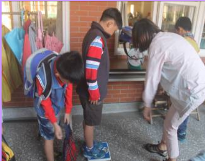
先測量體重再測量書包重量