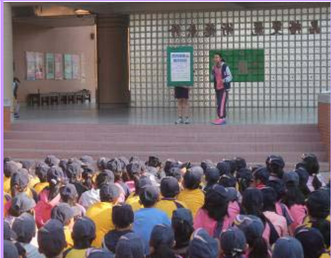
自治鄉長宣導落實書包減重三動作