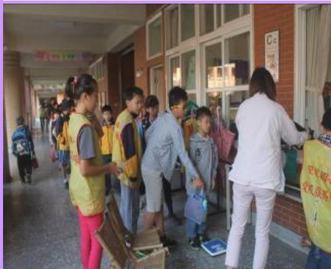
由愛校服務隊的同学協助書包抽測