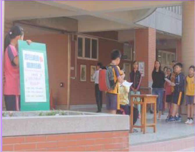
書包抽測不合格者會發下通知單