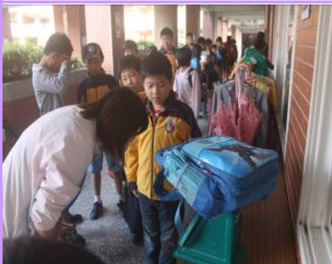
書包重量不可以超過體重的 1/8