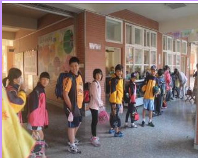
利用 7:10~7:40 進行隨機書包抽測