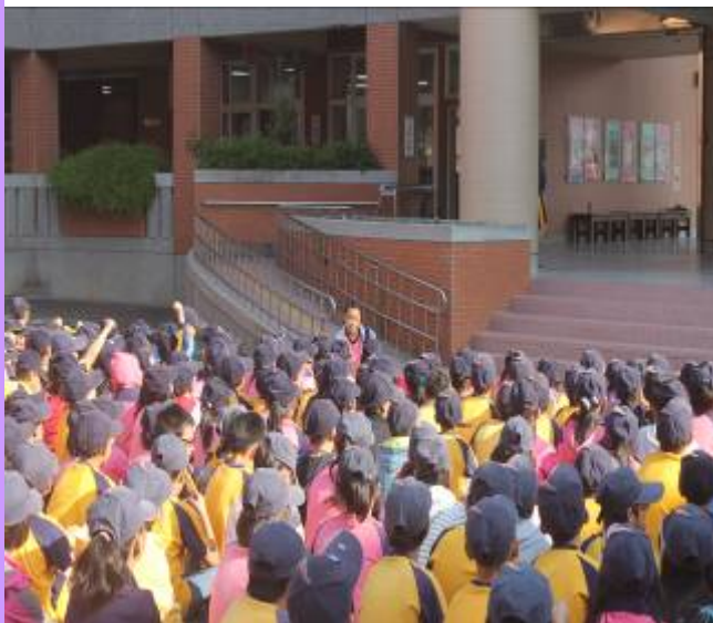
戲劇結束後進行有獎徵答