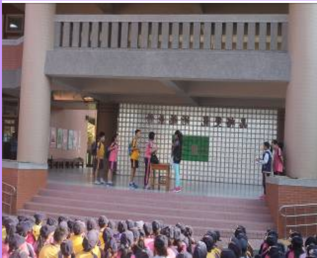
透過戲劇演出書包抽測的過程