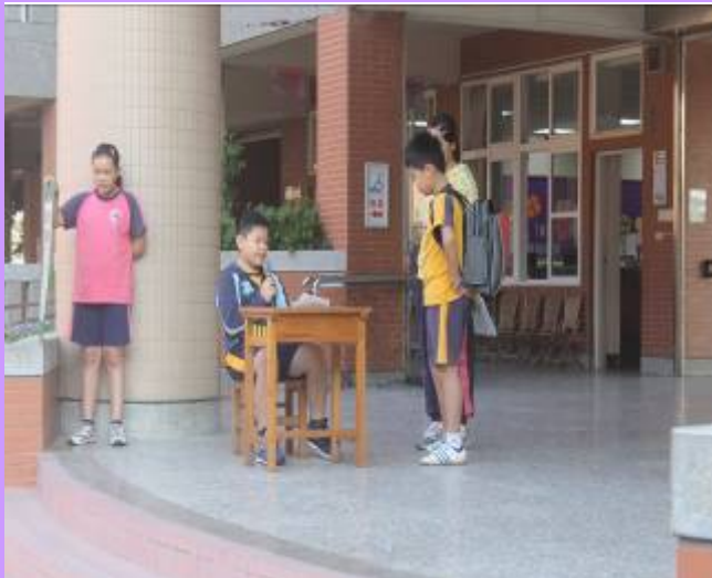
書包過重會影響學童的脊椎發展