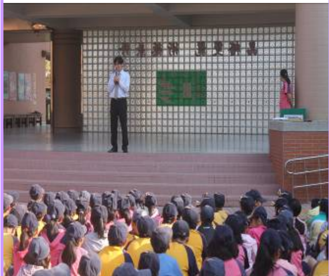
校長宣導書包減重的重要性