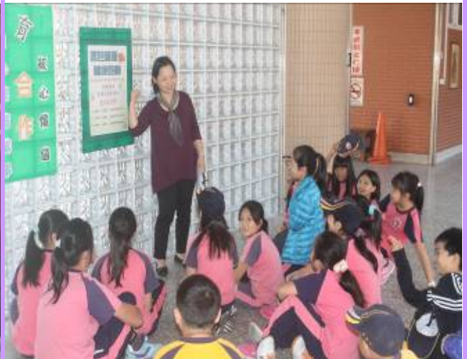
宣導落實書包減重三動作