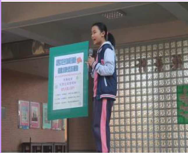
由自治鄉長利用朝會進行海報宣導