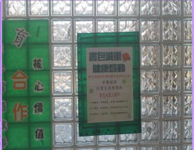
將書包減重海報張貼於水晶牆前