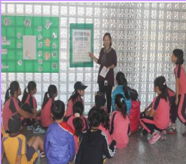
書包的重量不可以超過體重的 1/8