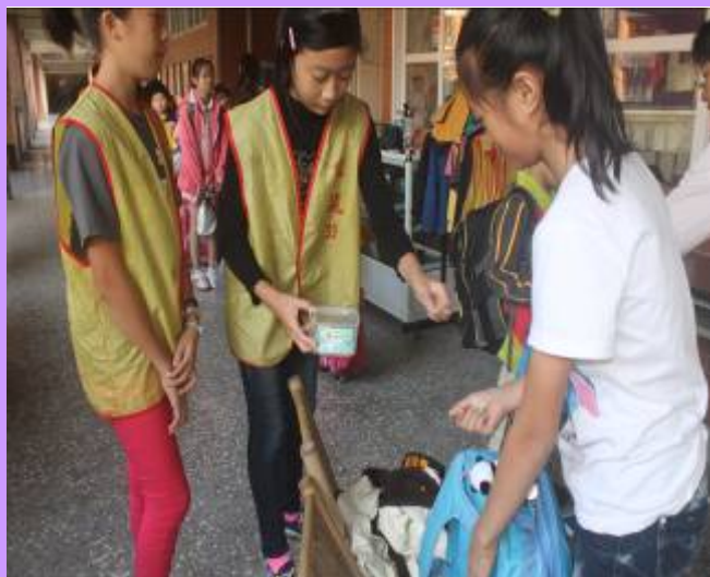
書包抽測合格者頒發榮譽貼紙獎勵