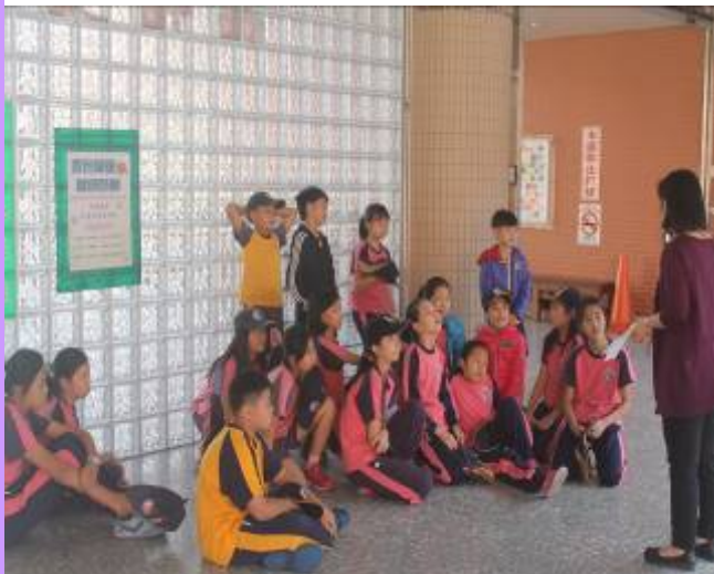
任課老師自行帶學生進行宣導