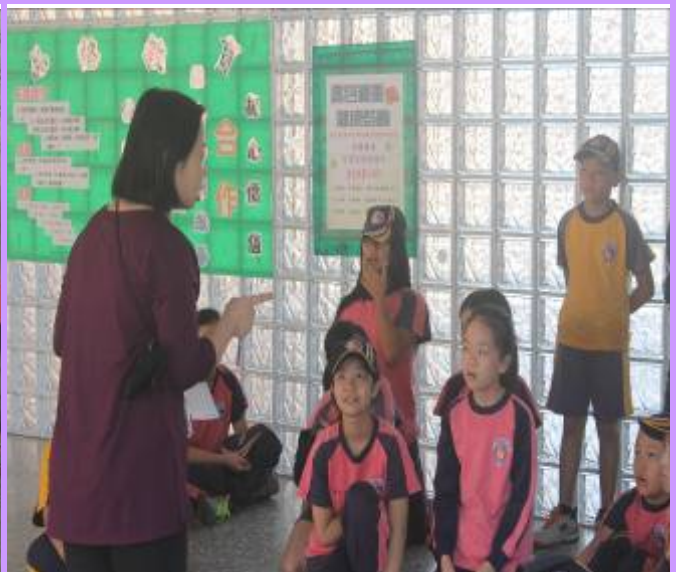
書包超重將影響學生的脊椎